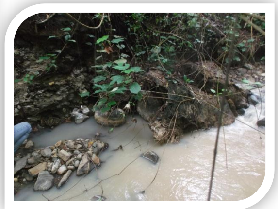
Sumber Mata Air Panas Desa Way Urang Kecamatan Padang Cermin.